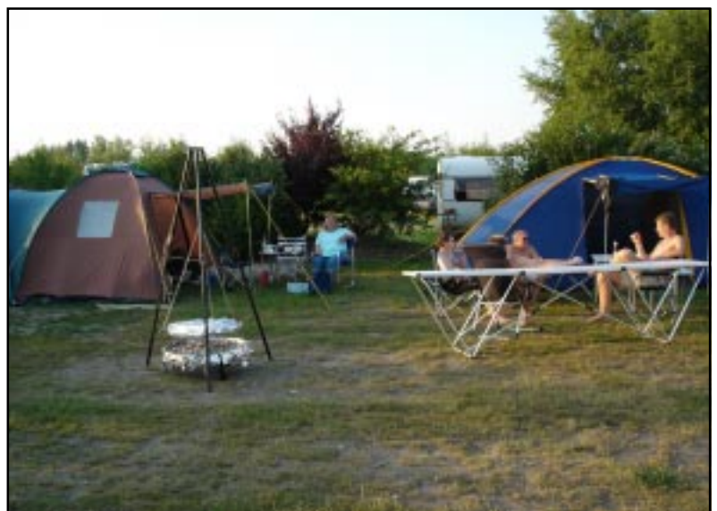
So war es in Hemmoor 2005